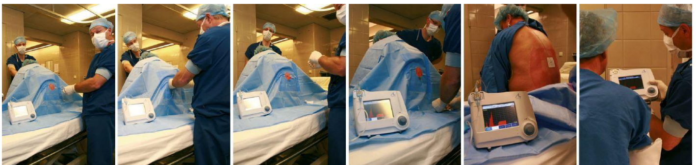
Start of the procedure

Termen de garanție: 24 luni pentru echipamente, 6 luni pentru accesorii.